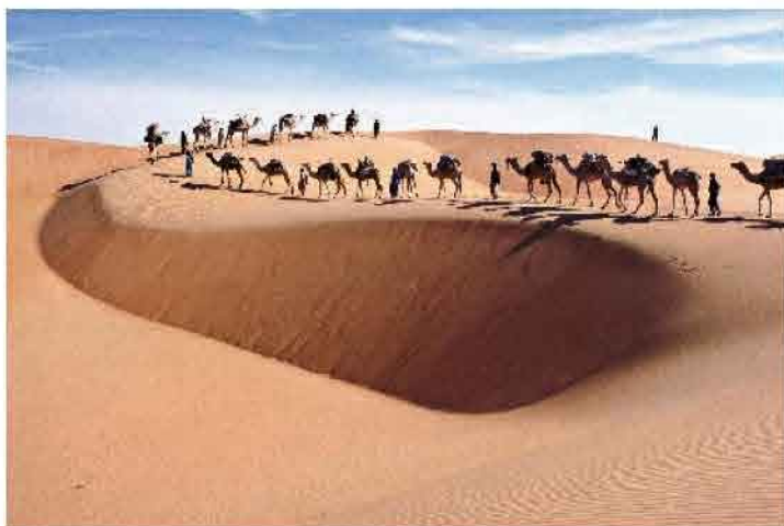
Le photographe avec un livre sur l'art rupestre. Une exposition met en lumière ses magnifiques images du Sahara (ci-dessus).